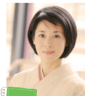
サポーター ファイル 03 俳人 黛まどか

2002年『京都の恋』で第2回山本健吉文学賞受賞。2010年4月より1年間、文化庁「文化交流使」としてパリを拠点に活動。現在「日本再発見塾」呼びかけ人代表、京都橘大学客員教授などを務める。