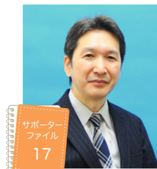
東京大学大学院医学系研究科 精神医学・教授