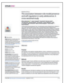
Nakanishi M, et al. (2019) The association between role model presence and self-regulation in early adolescence: A cross-sectional study. PLOS ONE 14(9): e0222752. https://doi.org/10.1371/journal.pone.0222752